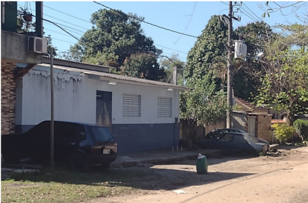
Abrigo de Nova Iguaçu (Escola desativada, reformada para receber os Warao em Tinguá – N.I.)