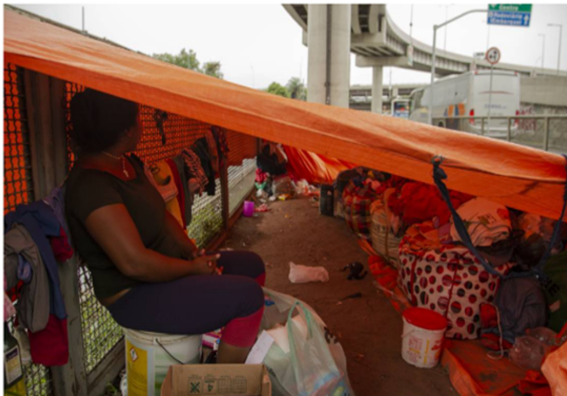
FIGURA 6– ABRIGADOS NA RODOVIÁRIA NOVO RIO

Em sua peregrinação, que já dura um ano, grupo percorreu trajeto de quase 7 mil quilômetros, viajando de ônibus com escala em pelo menos dez cidades do país antes de chegar ao Rio